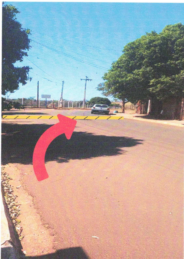
Sentido: Centro/Cór.Manoel Baiano